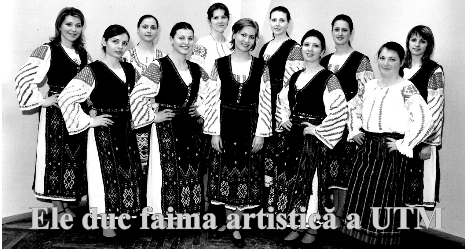
Ele duc faima artistică a UTM