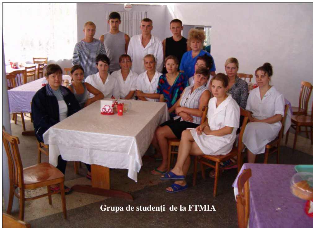
Grupa de studenți de la FTMA

nivelul de deservire a fost apreciat de către acei care s-au odihnit vara aceasta pe litoral.